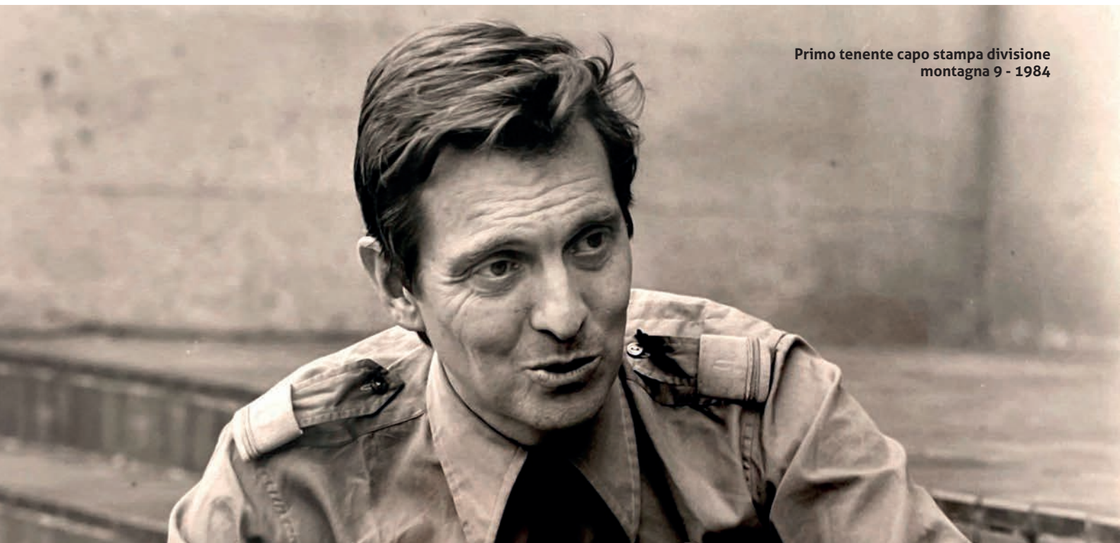
Primo tenente capo stampa divisione montagna 9 - 1984

sarebbe piaciuto dirigere un grande albergo ma già allora ero dell'avviso che non si doveva mollare ciò che si era iniziato. Così l'ho finita e ho frequentato pure la scuola ufficiali. Un'esperienza che t'insegna molto. Per esempio che prima di riposare devi aver messo tutto in ordine. Ma GIÀ Durante la scuola reclute, quando tornavi stanco morto da una marcia se non avevi prima pulito il fucile, le scarpe e tutto il resto non andavi a letto. Un'altra cosa mi è rimasta da quell'esperienza: se vuoi che una cosa non ti faccia più paura, non la devi evitare: la devi superare.