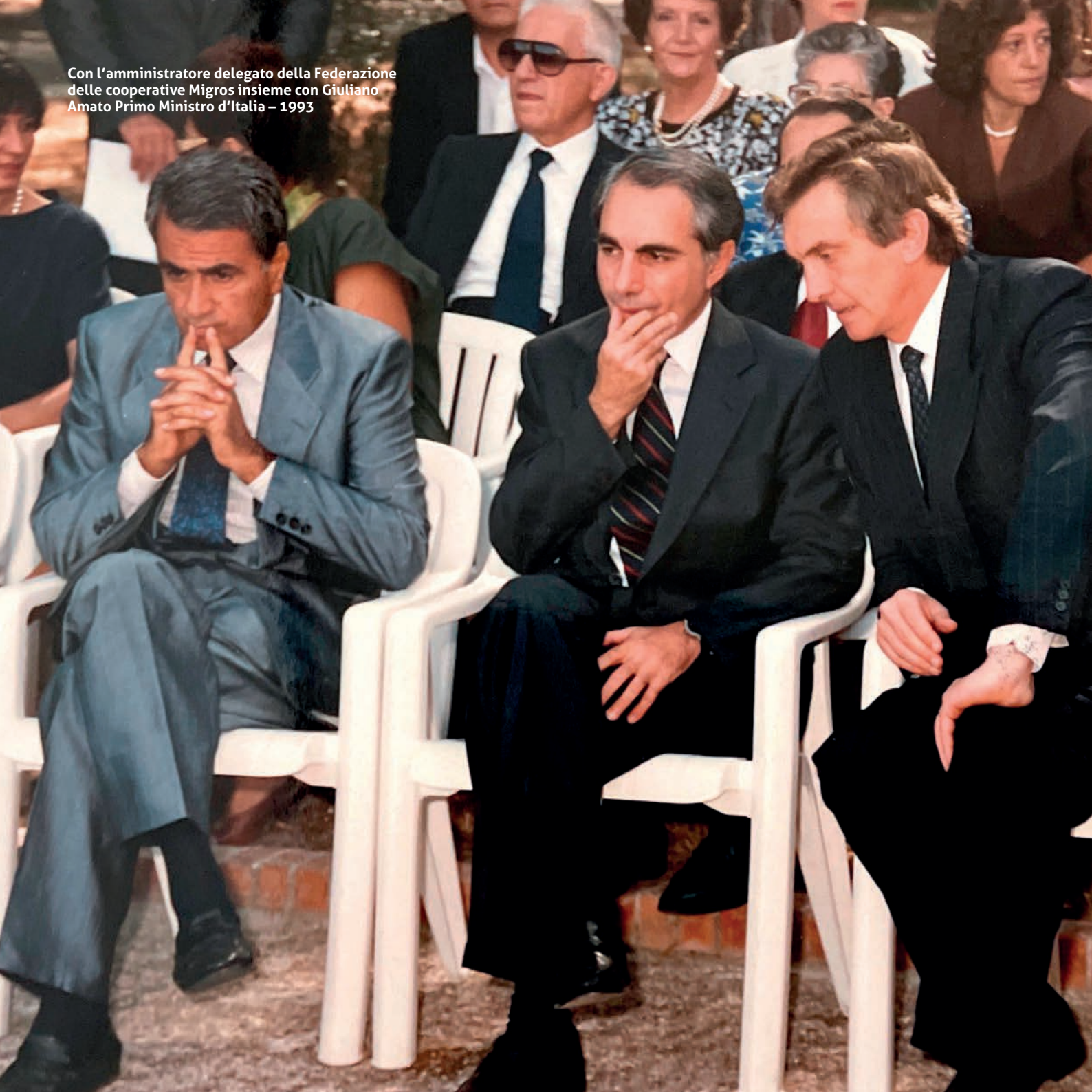
Con l'amministratore delegato della Federazione delle cooperative Migros insieme con Giuliano Amato Primo Ministro d'Italia - 1993